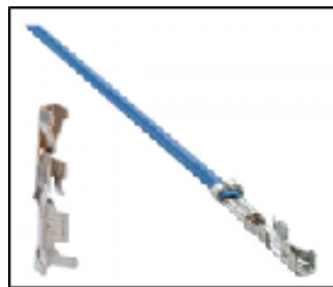
コネクタ端子（圧着端子）